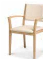
786/24 • Stapelsessel • Mit Armlehnen