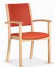
Modell Arko S. 12-13