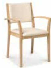
Modell Seta S. 14-15