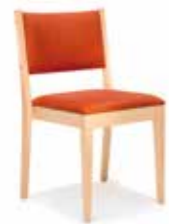
Modell Luca S. 10-11