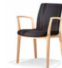
3552/4 • Stapelsessel • Mit Armlehnen • Sitzschale dick gepolstert • Sitzhöhe 43,5 cm

Aus der gleichen Familie sind auch Fauteuils erhältlich.