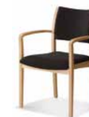
571/24 • Stapelsessel • Mit Armlehnen