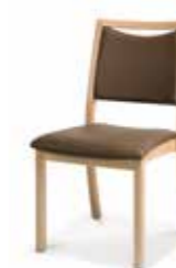
750/05 • Stapelstuhl • Mit Griffleiste