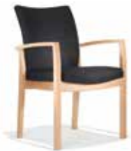
Modell Palato S. 8-9