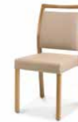
LH09049 • Stapelstuhl • Mit Griffleiste