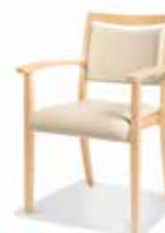
745/15 • Stapelsessel • Mit Knaufarmlehnen • Mit Griffleiste

Aus der gleichen Familie sind auch Fauteuils und Bänke erhältlich.