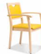
Modell Sixty2 S. 20-21