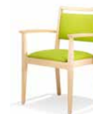
1507/4 • Stapelsessel • Mit Armlehnen • Mit Griffleiste

Aus der gleichen Familie sind auch Fauteuils und Bänke erhältlich.