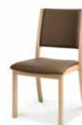
750/04 • Stapelstuhl