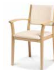
786/14 • Stapelsessel • Mit Knaufarmlehnen