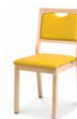
62-11/1 • Stapelstuhl