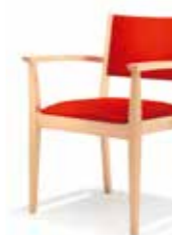
1505/4 • Stapelsessel • Mit Armlehnen