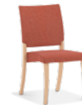
44-11/1 • Stapelstuhl