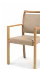
LH06A49 • Stapelsessel • Mit Armlehnen • Mit Griffleiste