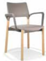
Modell Arn S. 4-5