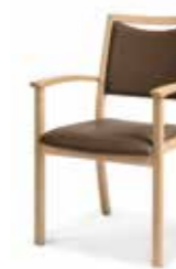
750/15 • Stapelsessel • Mit Armlehnen • Mit Griffleiste

Aus der gleichen Familie sind auch Fauteuils erhältlich.