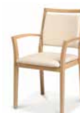
786/25GZ • Stapelsessel • Mit Armlehnen • Mit Griffleiste

Aus der gleichen Familie sind auch Fauteuils und Bänke erhältlich.