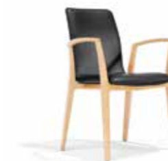
3522/4 • Stapelsessel • Mit Armlehnen • Sitzhöhe 42,5 cm