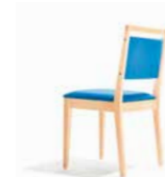
1507/2 • Stapelstuhl • Mit Griffleiste