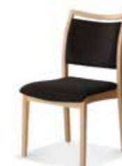
570/05 • Stapelstuhl • Mit Griffleiste