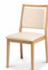
786/05GZ • Stapelstuhl • Mit Griffleiste