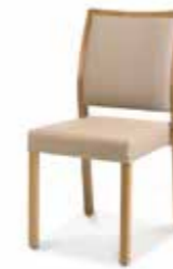
LH09045 • Stapelstuhl