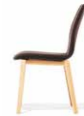
3522/2 • Stapelstuhl • Sitzhöhe 42,5 cm