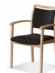
570/15 • Stapelsessel • Mit Knaufarmlehnen • Mit Griffleiste