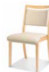
745/05 • Stapelstuhl • Mit Griffleiste