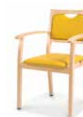
62-13/1 • Stapelsessel • Mit Armlehnen

Aus der gleichen Familie sind auch Fauteuils erhältlich.