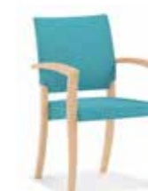
44-14/1 • Stapelsessel • Mit Armlehnen