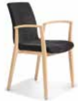
Modell Yara S. 6-7