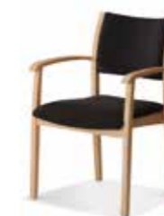
570/14 • Stapelsessel • Mit Knaufarmlehnen