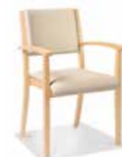
Modell mona+ S. 18-19