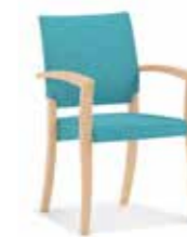
Modell Theorema S. 22-23