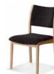
570/04 • Stapelstuhl