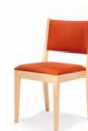
1505/2 • Stapelstuhl