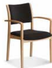
Modell Cado S. 16-17