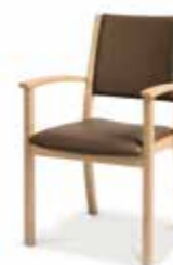
750/14 • Stapelsessel • Mit Armlehnen