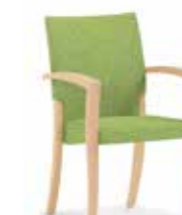
44-14/5 • Stapelsessel • Mit Armlehnen

Aus der gleichen Familie sind auch Fauteuils erhältlich.