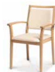
786/15GZ • Stapelsessel • Mit Knaufarmlehnen • Mit Griffleiste