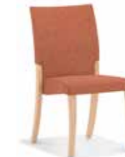
44-11/5 • Stapelstuhl