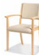
745/14 • Stapelsessel • Mit Knaufarmlehnen