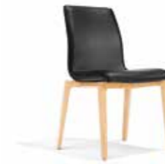
3552/2 • Stapelstuhl • Sitzschale dick gepolstert • Sitzhöhe 43,5 cm