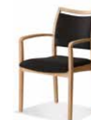
571/25 • Stapelsessel • Mit Armlehnen • Mit Griffleiste