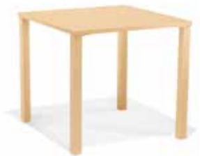
Tische ab S. 26

Speziell für den Pflegebereich: Komfort Ergonomie Hygiene