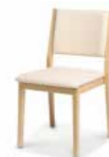
786/04 • Stapelstuhl