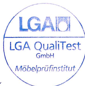
Dr. Ing. W. Schubert Zertifizierungsstelle

Untersuchungsbericht-Nr. 736 1150 test report no. 735 1150