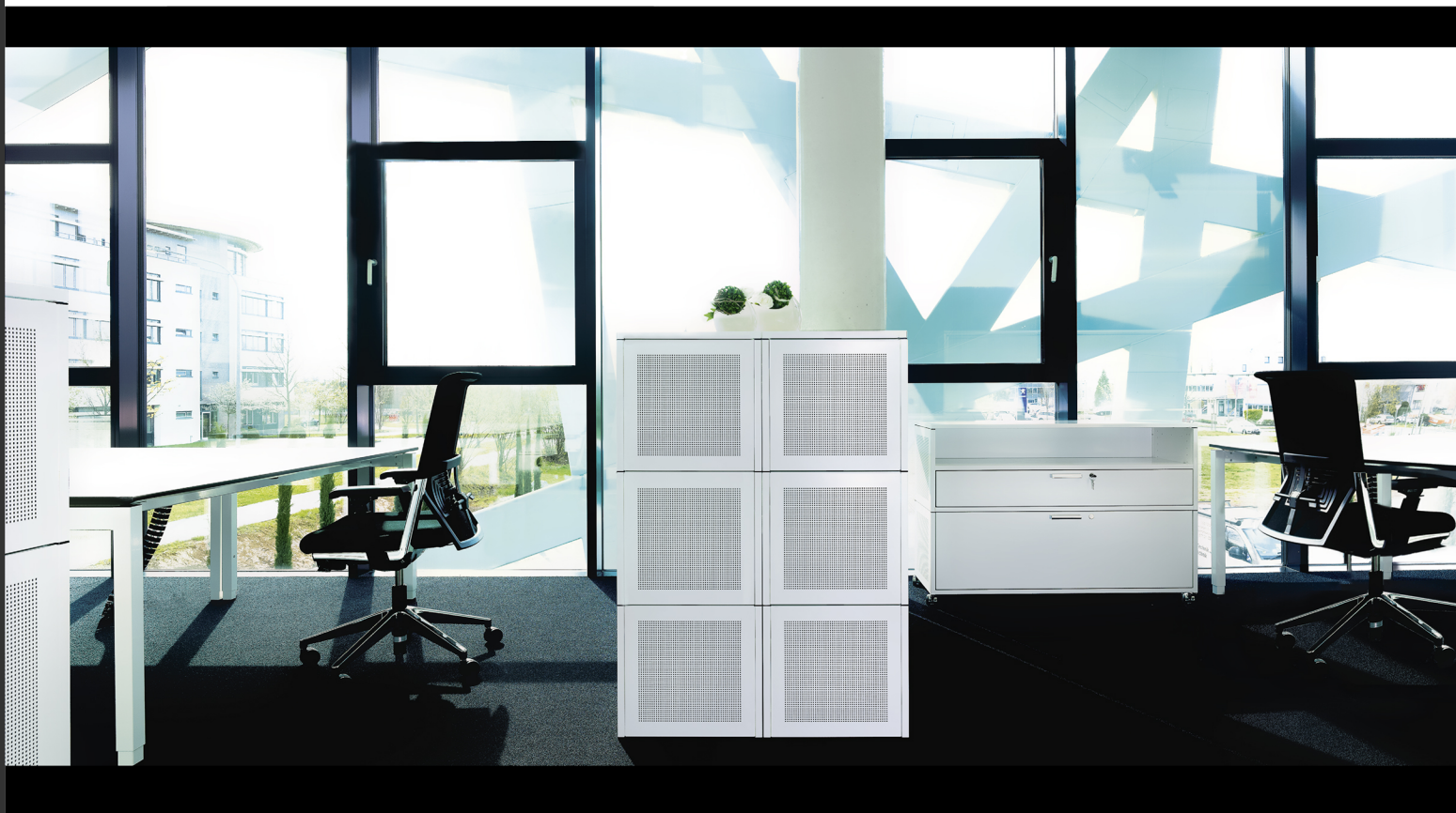
Ästhetik und Funktion auf hohem Niveau